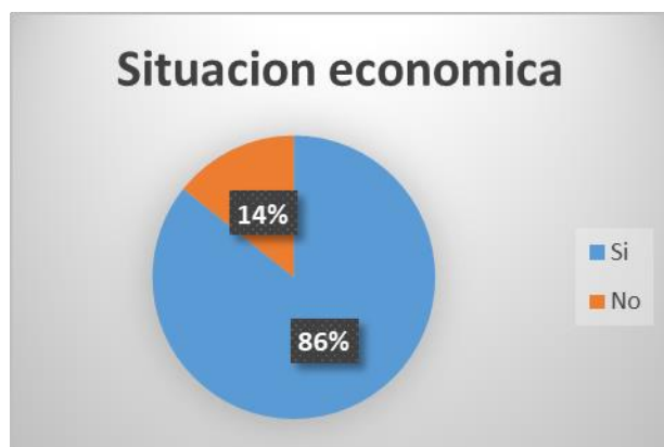
Situación económica de la mujer